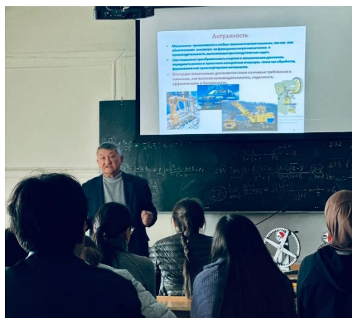
Фото 5 – Дискуссия и ответы на вопросы. Круглый стол от 13 ноября («неделя науки -25»)