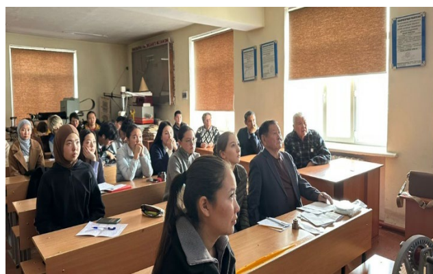
Фото 3-4 – Круглый стол каф. МиС 13 ноября. Участники – ППС кафедры и студенты («неделя науки -25»)