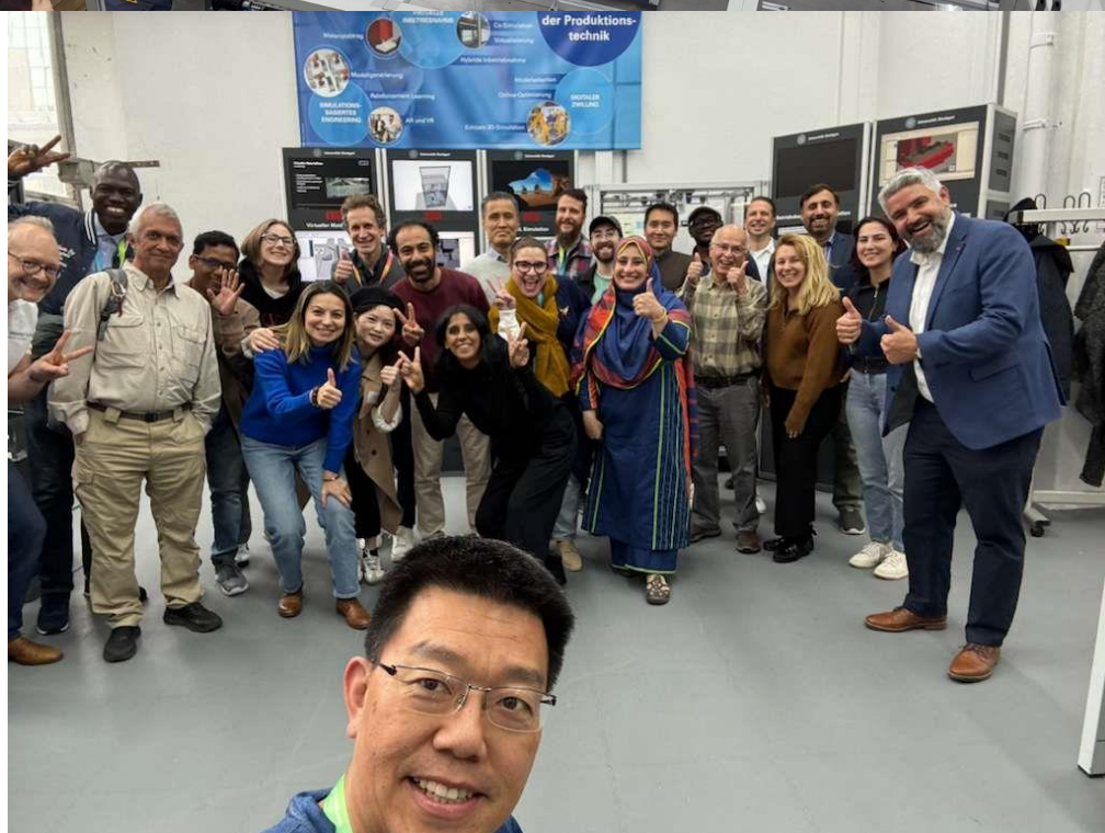
Рисунок 6. Производственная лаборатория фирмы Bosch.