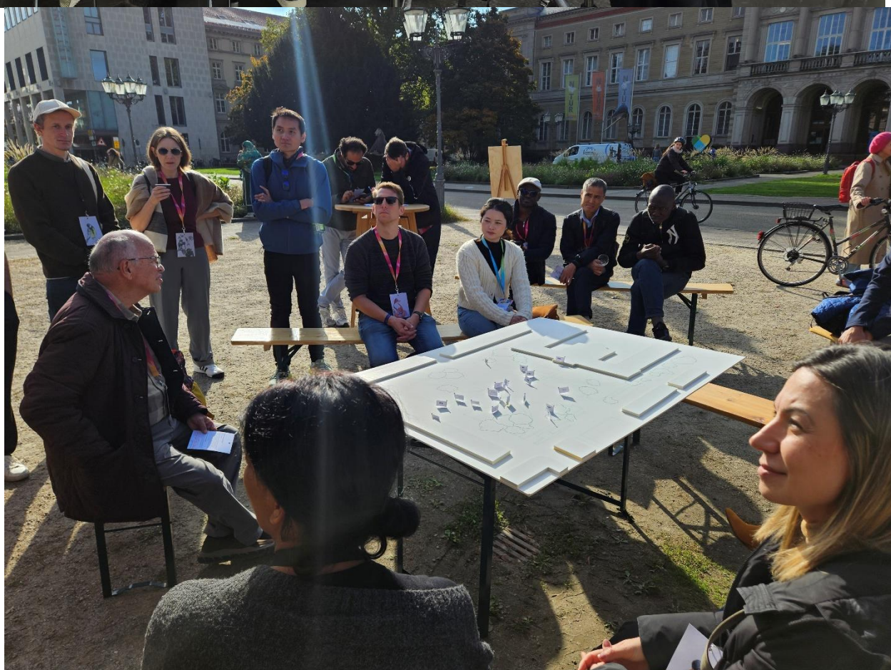
Рисунок 1. Семинар в КИТ