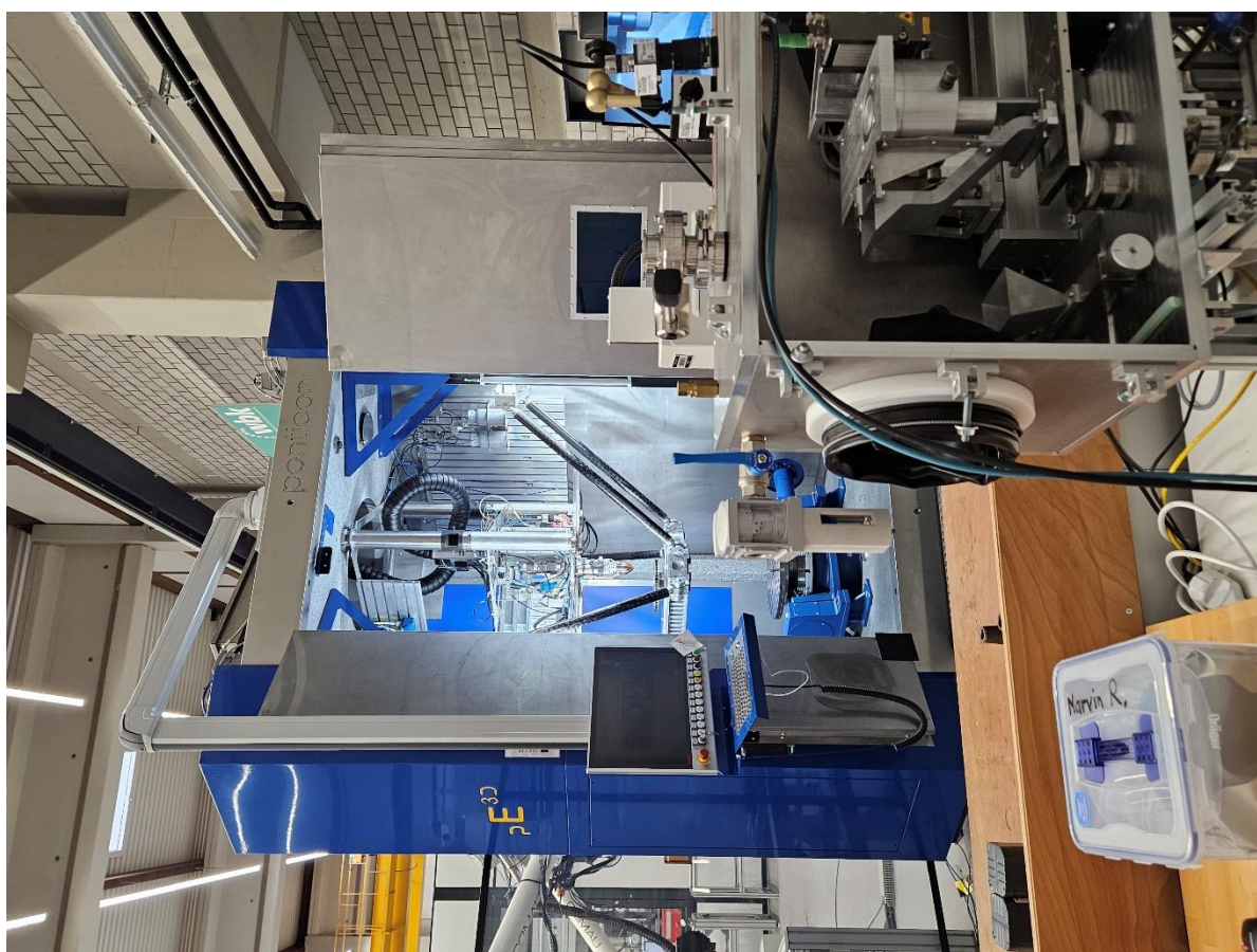
Рисунок 2. Посещение Лабораторий КИТ