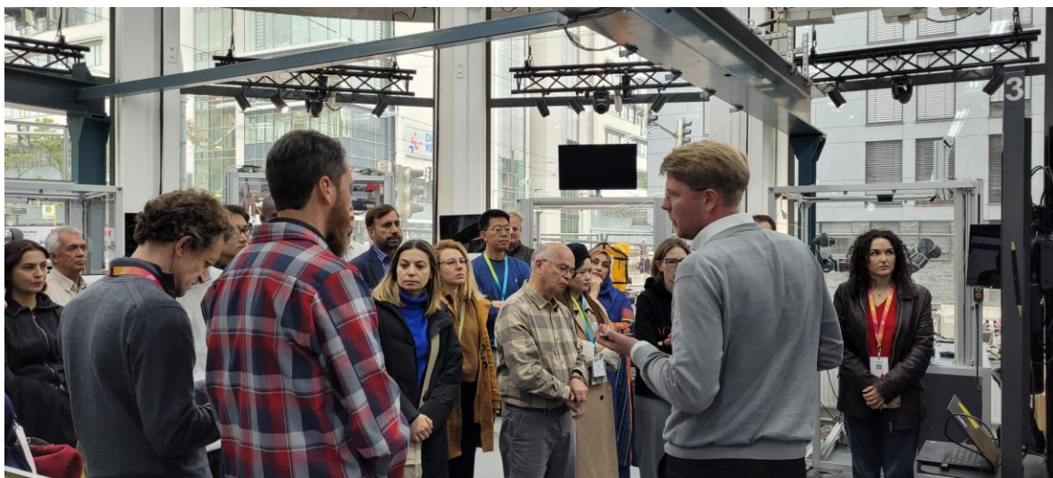
Рисунок 5. Технопарк Университета Штуттгарт