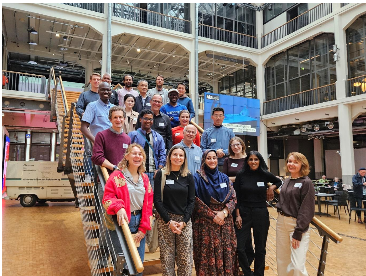
Рисунок 3. Посещение музея в Карлсруэ