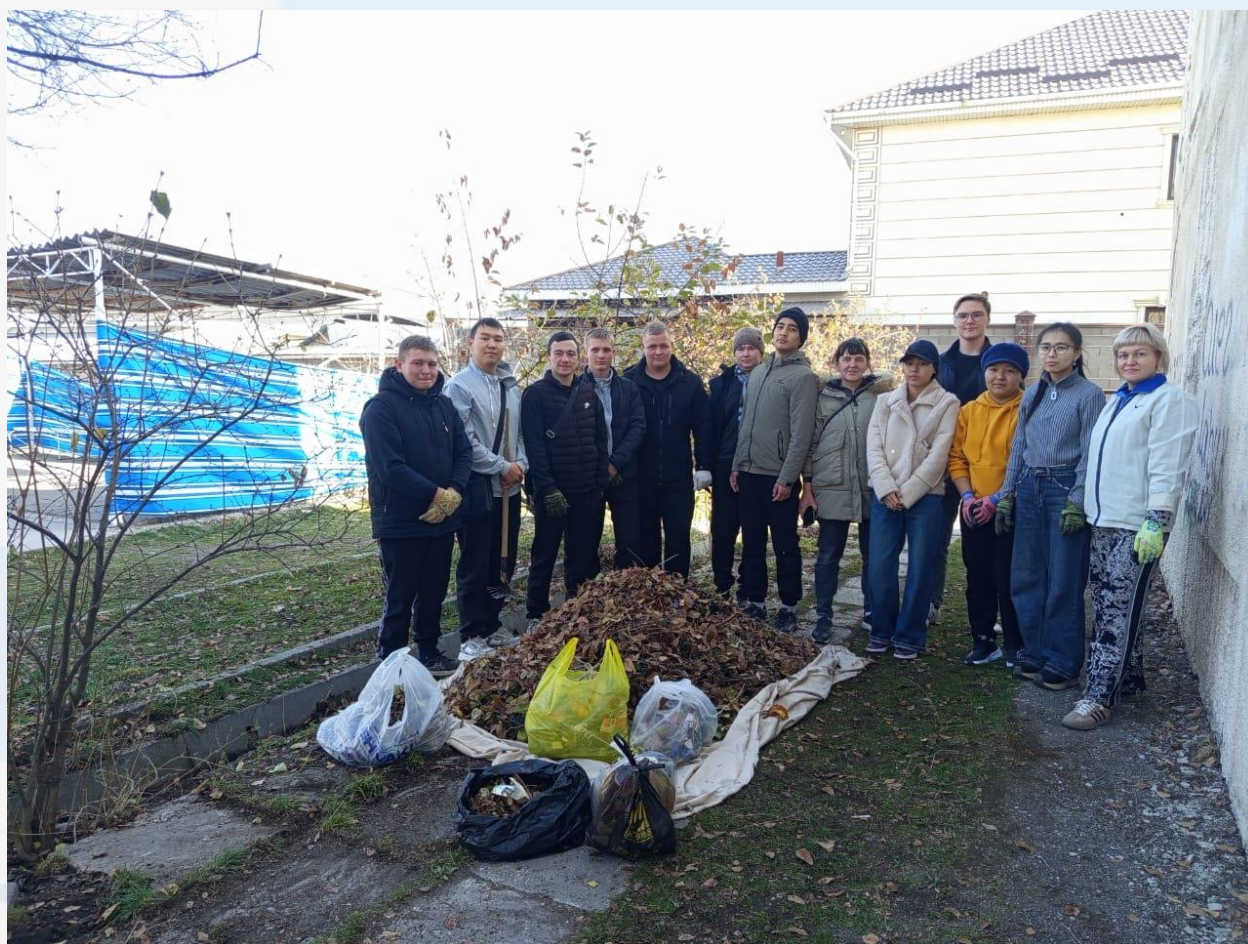
Уборка территории филиала КГТУ им. И Раззакова

Было организовано чаепитие со студентами в дружеской и деловой обстановке, способствующее неформальному общению и сплочению коллектива